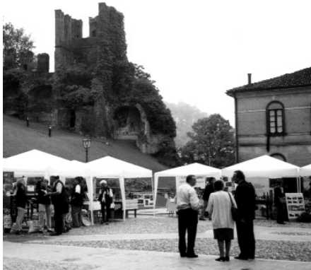
edizione 2000 di "La fattoria nel Castello"

Quest'anno hanno partecipato all'iniziativa, con le proprie