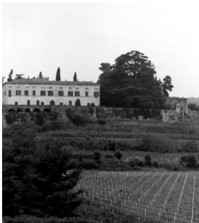
Vigneti della Franciacorta ai piedi del castello di Bornato

In occasione del ventennale di Enoservice, importante società di servizi nel settore vitivinicolo con sede a Erbusco nel cuore della Franciacorta, è stato dato alle stampe il volume Libellus de vino mordaci ovvero Le bollicine del terzo millennio (Edizioni Franciacorta). Si tratta della stampa anastatica del Libellus de vino mordaci , ossia "Del vino frizzante", opera del medico bresciano Girolamo Conforti pubblicata nel 1570, che rappresenta il primo testo italiano sulla produzione e il consumo dei vini "con le bollicine". Curatore di questa edizione è dell'ampia premessa, è Gabriele Archetti, docente universitario ed esperto di storia della vite e del vino nel Medioevo, mentre la traduzione dal latino del Libellus è stata affidata a Ennio Ferraglio.