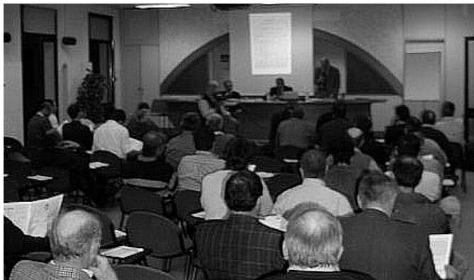
"Il valore del latte" - Assemblea dell'Aiplb a Mantova